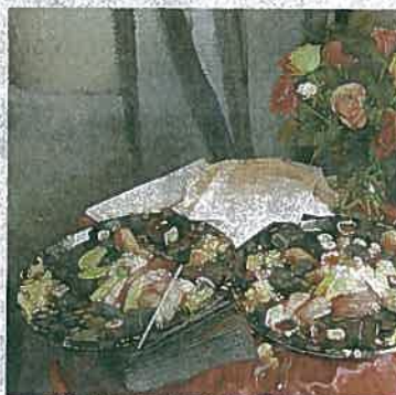
Zür illegalen Party gibt es Plättchen mit Sushi-Häppchen und Blumen.