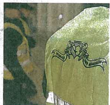
Auf den Leuchtwesten prangt ein irgendwie offiziell wirkendes Logo.

Teppich und sieht sich um. Als seine Frage nach den Verantwortlichen unbeantwortet bleibt, sagt er zu einer Gruppe, die sich um ihn gebildet hat: «Aha, alle ein bisschen. Ich sage euch jetzt Folgendes: Ich will keine Toten, der obere Stock ist sehr gefährlich. Die Wandmalereien dürfen auf keinen Fall beschädigt werden, und am Sonntag müsst ihr wieder gehen. Haltet ihr euch an diese Abmachungen, schicke ich die Polizei sofort weg und wünsche euch eine schöne Party.»